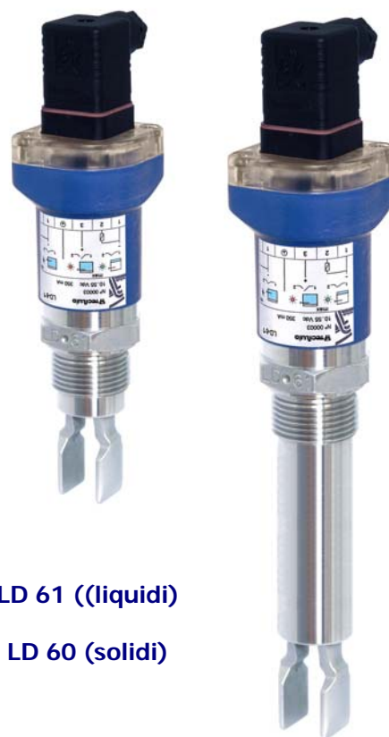
LD 61 ((liquidi)

Un led incorporato per il controllo dello stato fornisce un ausilio importante all'operatore. Da non trascurare che questo sistema di allarme garantisce anche una sicurezza attiva.